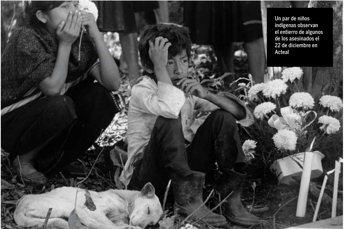
Un par de niños indígenas observan el entierro de algunos de los asesinados el 22 de diciembre en Acteal