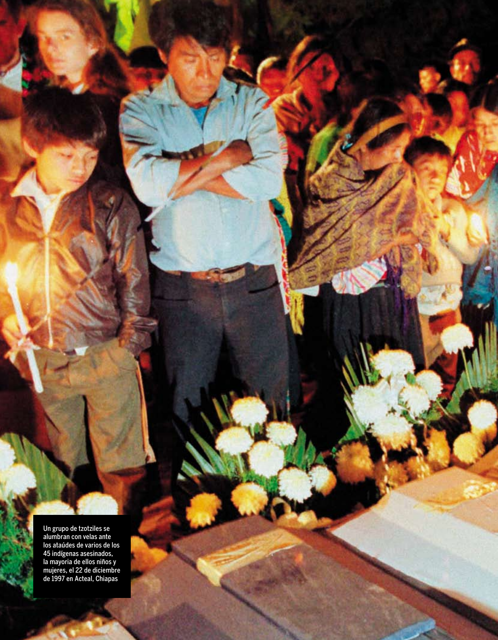
Un grupo de tzotziles se alumbran con velas ante los ataúdes de varios de los 45 indígenas asesinados, la mayoría de ellos niños y mujeres, el 22 de diciembre de 1997 en Acteal, Chiapas