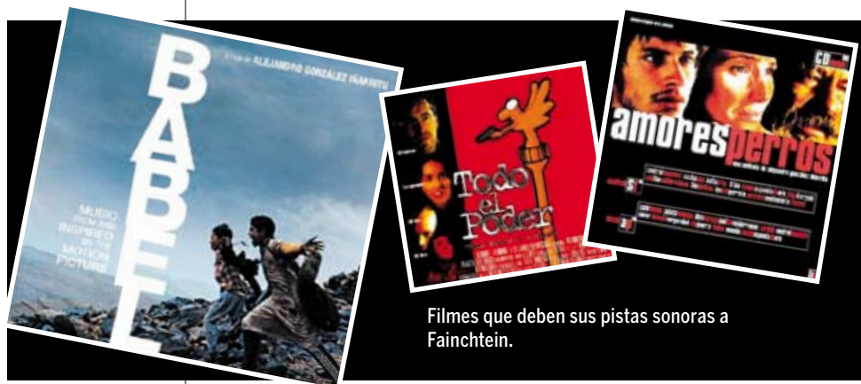
Filmes que deben sus pistas sonoras a Fainchtein.

¿Qué cuentas de México? En una película puedes tener a Shakira y a Justice y un vallenato y una cumbia. ¿Qué historia contamos de México? ¿La de Felipe Calderón? ¿La de Andrés Manuel López Obrador? ¿La tuya, la mía? ¿La de un México que está muy bien, la de un México que está muy mal? ¿La de un México de 60 millones de pobres, o la de un México en donde Carlos Slim es dueño de toda nuestra lana, del billete, de nosotros?... ¿Qué historia cuentas? Porque en México cabe el Cuarteto Latinoamericano de Cuerdas tocando a Silvestre Revueltas, cabe Cártel de Santa, caben los ene mil grupos que vienen como Justice, o como en el festival de MX Beat donde estaba M.I.A, y donde pueden venir los Arctic Monkeys. Ese es un México real, un soundtrack interminable.